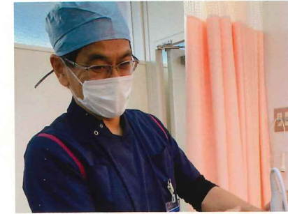
ペインクリニック内科・麻酔科