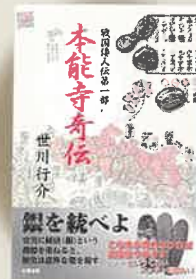
戦国倭人伝第一部 「本能寺奇伝」

「この本が売れなければ出版社やめます」と宣言した彩雲出版は、今も出版社として残っているそうです。