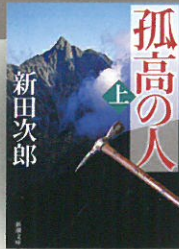
孤高の人 [上] 新田次郎 / 新潮文庫刊