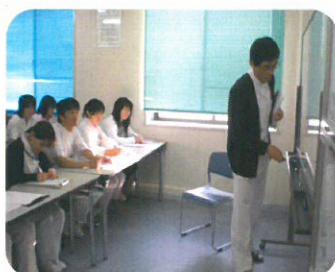
今回も延べ40数名が参加し、みな熱心に聞いていました。