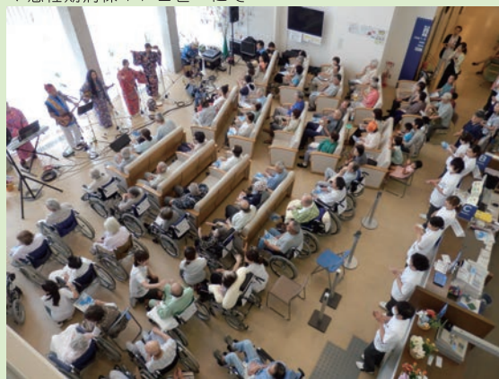
▼急性期病棟1フロアにて