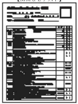
※内容が分からないようぼかしています

MMSEは30点満点、30項目問診票は重症度を定める手がかりとなります。更にMMSEが満点で30項目問診票に該当項目の無い方には“かなひろい、複雑迷路”を追加し、早期認知症診断にも役立っています。