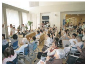
音楽に合わせてレクリエーション体操も行い、会場全体が盛り上がります。