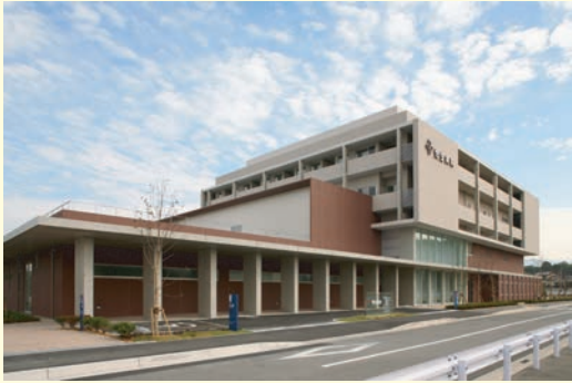
恒生病院外観（西側より）

「脳梗塞の患者全員に使ったらいいじゃないか？」と思うられるかもしれません。しかし、