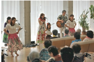
ダンスも衣装も素敵！！